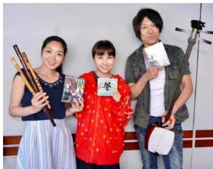
Tokyo FM「ももいろクローバーZのSUZUKIハッピー・クローバー！」 ゲスト出演