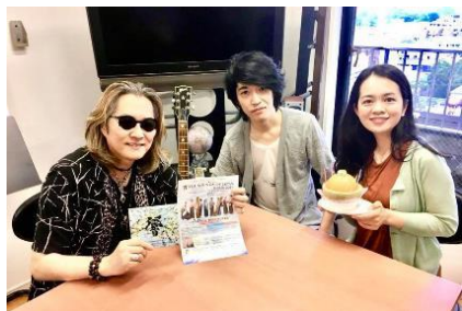
FMヨコハマ「石井竜也のFLYING HEART」 ゲスト出演