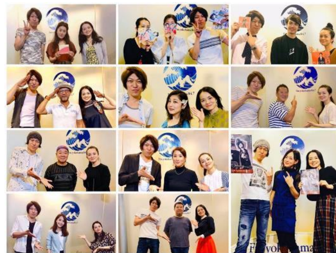
2019年7月～12月放送 FMヨコハマ「THE SOUNDS OF JAPAN」