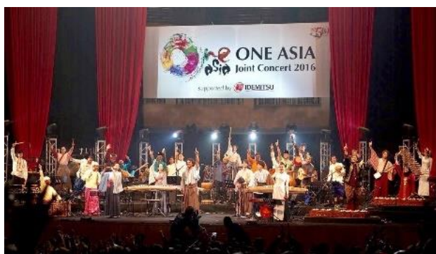
■2016年 シンガポール エスプラネードホール 公演 他1カ国にて開催