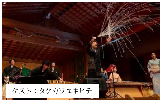
ゲスト：タケカワユキヒデ

2019年5月～12月にかけて、コラボレーションアルバムに参加いただいたアーティストをゲストに迎え、「響ツアー」を開催。7公演のうちの2公演は世界遺産「宗像大社」「金峯山寺蔵王堂」にて、「H ZETTRIO」とともに奉納コンサートを開催。