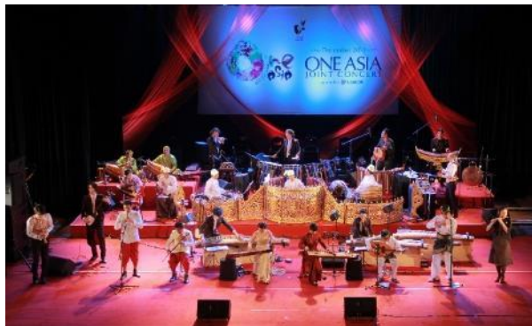
■2014年 ミャンマー ヤンゴン国立劇場公演 他2カ国にて公演