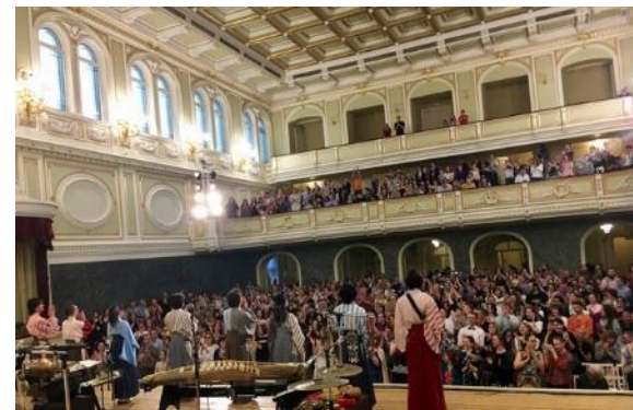
国立アカデミーカペラ（ロシア）