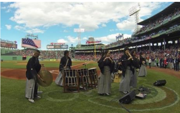
アメリカ国歌演奏（アメリカ/ウェンウェイパーク）