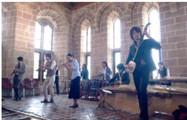
モン・サン・ミシェル修道院内（フランス）