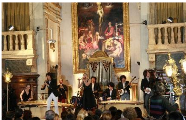
ゴンファローネ修道院礼拝堂（イタリア）