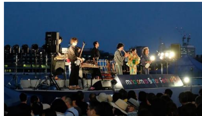
みなとみらいスマートフェスティバル2019