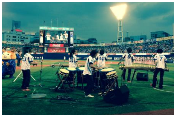
横浜DeNAベイスターズ『勝祭』