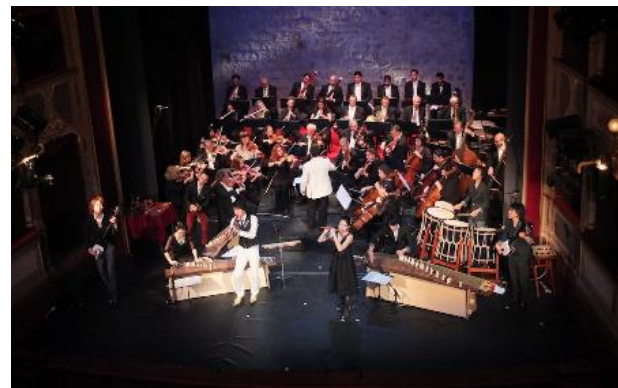
ドゥブロヴニク（クロアチア）