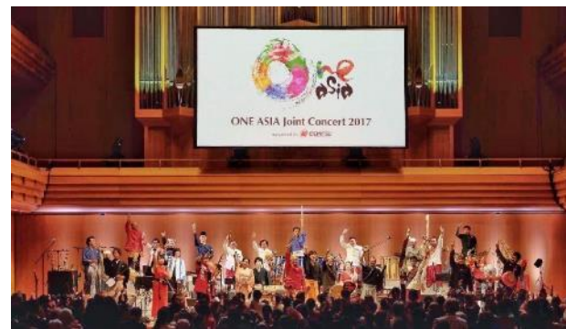
■2017年 東京 新宿オペラシティ公演 / 新宿中央公園公演