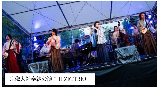
宗像大社奉納公演：H ZETTRIO