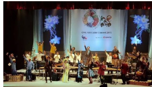
■2015年 ラオス 国立文化会館公演 他2カ国にて公演