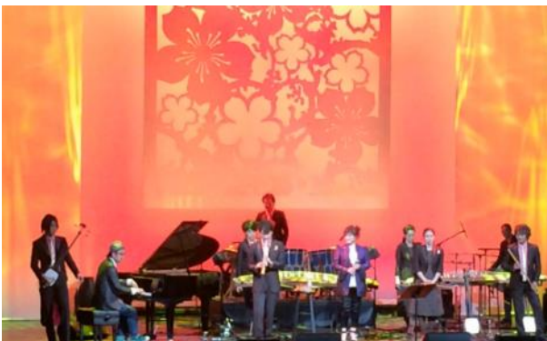
全米桜祭り（アメリカ/ワシントンD.C.）