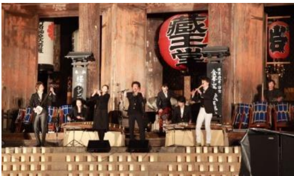
金峯山寺蔵王堂（奈良県）