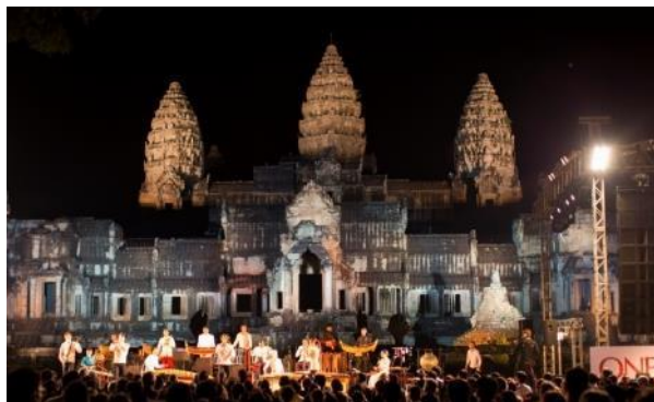
■2013年 カンボジア アンコールワット公演 他3カ国にて公演

2017年の東京公演では、中国、韓国、台湾の奏者を加え、アジア全14の国と地域の伝統楽器奏者が参加。