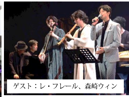
ゲスト：レ・フレール、森崎ウィン