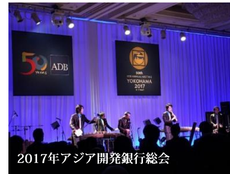
2017年アジア開発銀行総会