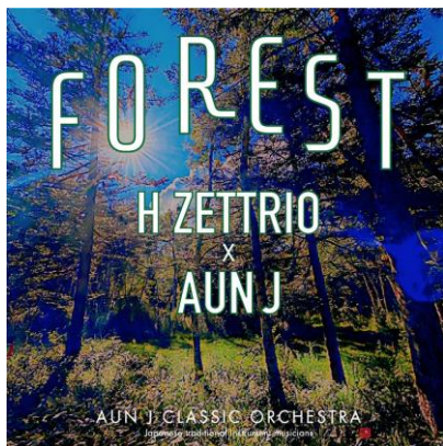
配信用「FOREST」ジャケットデザイン